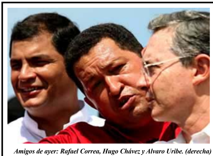
Amigos de ayer: Rafael Correa, Hugo Chávez y Alvaro Uribe. (derecha)

Por otra parte, el embajador de Nicaragua ante la Organi-