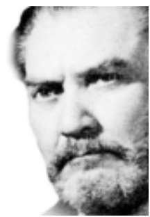
Salomón de la Selva