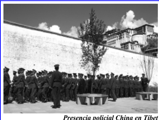
Presencia policial China en Tíbet

Fue dada a conocer ese día una declaración oficial del gobierno de la India. Por boca del primer ministro Nehru se supo que "al parecer" la lucha en Tíbet se había extinguido y que el gobierno indio "no tiene intención de intervenir en la revuelta de esa nación contra el régimen comunista que la domina". Expresó Nehru a continuación que carecía de información precisa