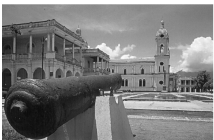
Plaza Central "Granada"

Es triste ponerse a recordar todas las vicisitudes porque ha atravesado Granada. Allí todo fue ruinas, desde la hermosísima Catedral, que la fortaleza