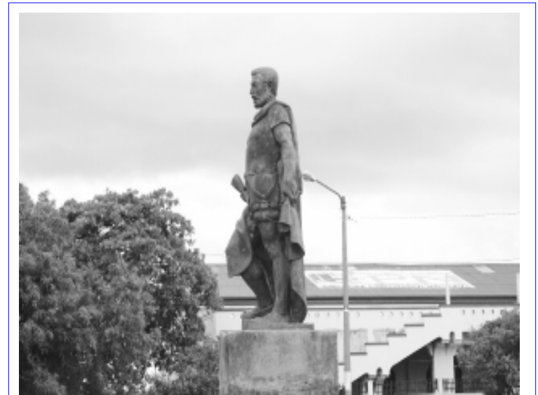
Escultura de Francisco Hernández de Córdoba, frente al Lago de Nicaragua en Granada

La gente aseguraba que aquella era una vida envidiable. No se conocían las pasiones devoradoras de hoy, que son las que han traído consigo el lujo, la avaricia, el afán de riqueza, y luego como concreción de todo, el amor desordenado y loco.