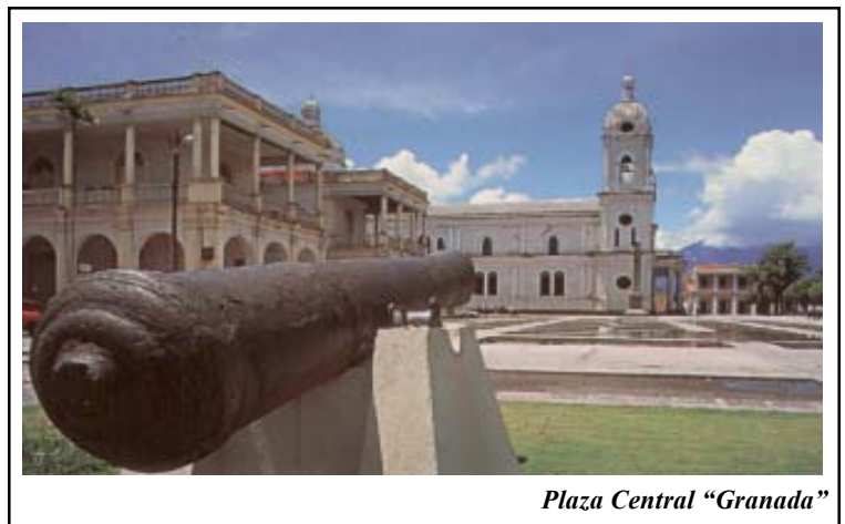
Plaza Central "Granada"

El actual departamento, bajo el nombre de Granada, fue creado por los decretos legislativos de 24 y 30 de agosto de 1,858, con los pueblos que corres-