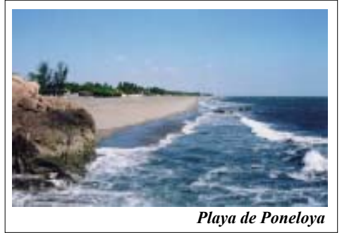
Playa de Poneloya

Entre sus templos sobresalen los de Catedral, La Merced, Subtiaba, San Felipe, San Juan, La Recolección, El Calvario, San