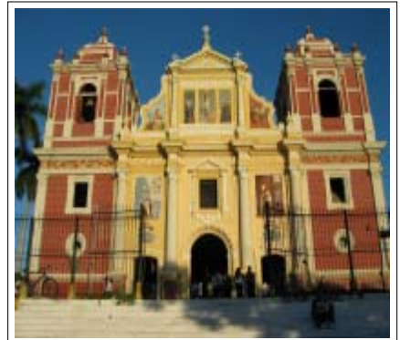
Iglesia El Calvario - León

Se caracterizó esta ciudad por tener varios teatros, Salones de Cine, tres Clubes Sociales, el de León, el de Artesanos y el de Contadores y Oficinistas. Cámara de Comercio, con oficina permanente, ofrece al turista los datos que éste necesita para orientarle tanto en su visita a la ciudad cabecera como de las capacidades de sus numerosos Municipios.