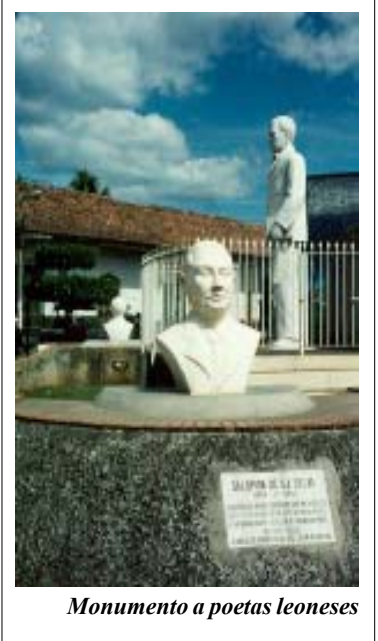
Monumento a poetas leoneses

El Departamento de León, dividida entre 10 municipios. La ciudad de León es la cabecera departamental, principal ciudad de Occidente y segunda en el país en población. Dista 90 km. de Managua. En su horizonte la vigila una fila de volcanes, siendo castigada de vez en cuando por las cenizas del Cerro Negro. En los alrededores hay tierras agrícolas muy productivas y tiene a Poneloya, distante 20 km, como su balneario favorito sobre el Pacífico.