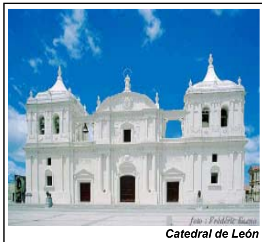
Catedral de León

Geomorfología: El Departamento de León se divide en cinco unidades fisiográficas paralelas. En su límite norte existen varias serranías que descienden de la altiplanicie de Estelí con el cerro Horno Grande (1,400 m) como el punto culminante del Departamento