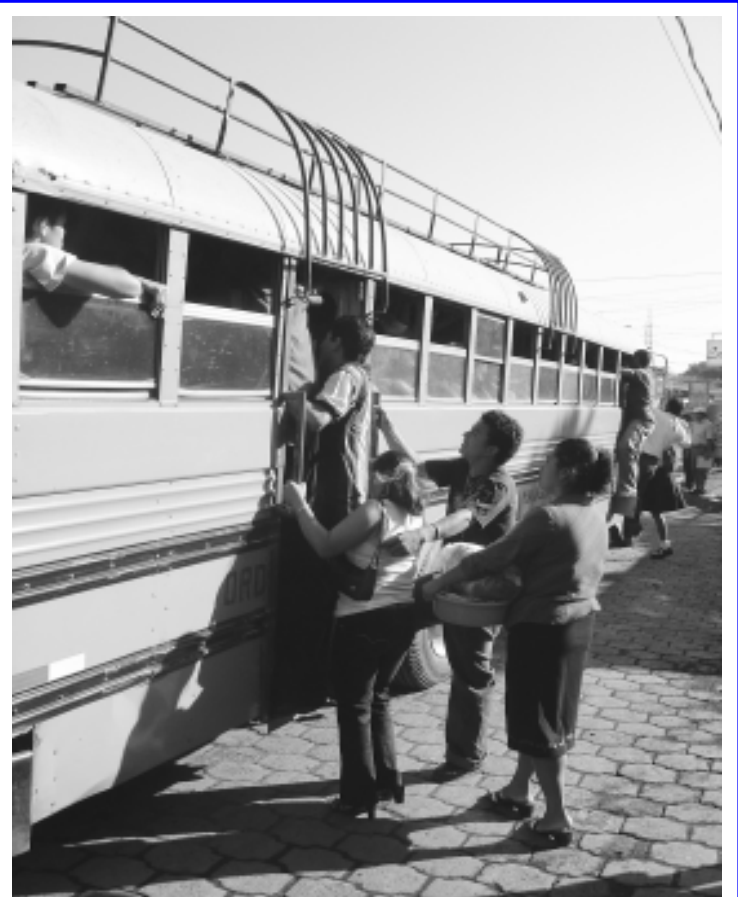
El transporte colectivo en Nicaragua, está lejos de solucionarse. El gobierno no está cumpliendo con los acuerdos, que pusieron fin, al último paro del transporte. El problema sigue vigente. Los buseros no quieren la tarifa sociales.