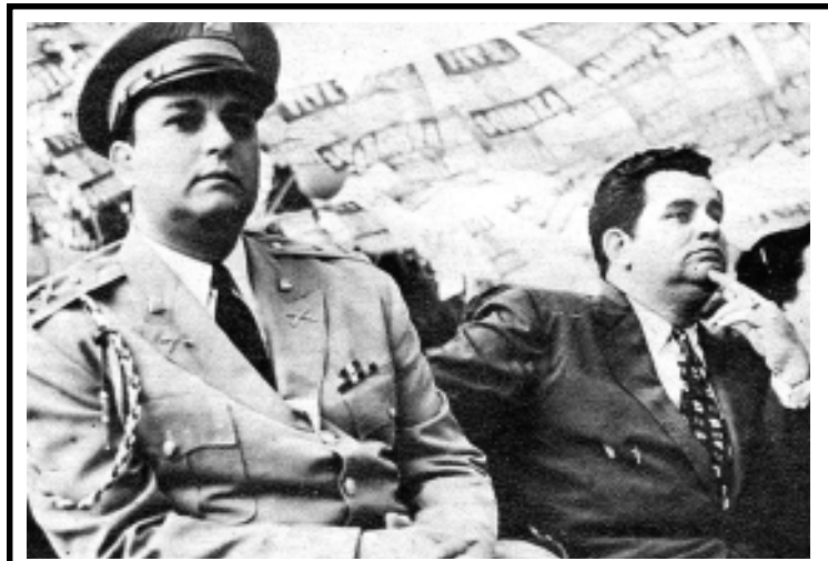
Los hermanos Luis Anastasio y Anastasio Somoza Debayle, hijos del fundador de la dictadura Anastasio Somoza García.

El Presidente Somoza insiste en que los ataques contra su régimen son inspirados, financiados y dirigidos por los, comunistas. Se duda muy poco de que los rojos esten explotando la impopularidad de los Somoza para sus propios fines. Pero los nicaraguenses que devotamente desean la caída de los Somoza son legión.