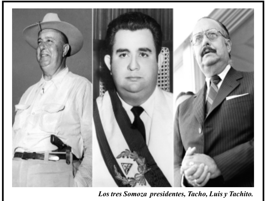
Los tres Somoza presidentes, Tacho, Luis y Tachito.

Pero, cuándo reinó la Democracia aquí? ¿Fué cuando el aventurero californiano William Walker se hizo proclamar presidente? ¿Cuándo habían dos gobiernos a la vez, el de Díaz y el de Moncada? ¿Cuándo los marinos americanos ocuparon el país? Habían desembarcado en 1912 sin duda