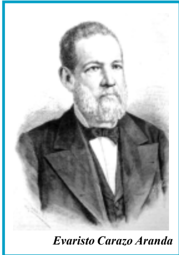
Evaristo Carazo Aranda

de octubre de 1890, entre acusaciones incluso de fraude cometido mediante el uso abusivo de la fuerza pública, salió electo por el voto popular, para el período 1891-1895.