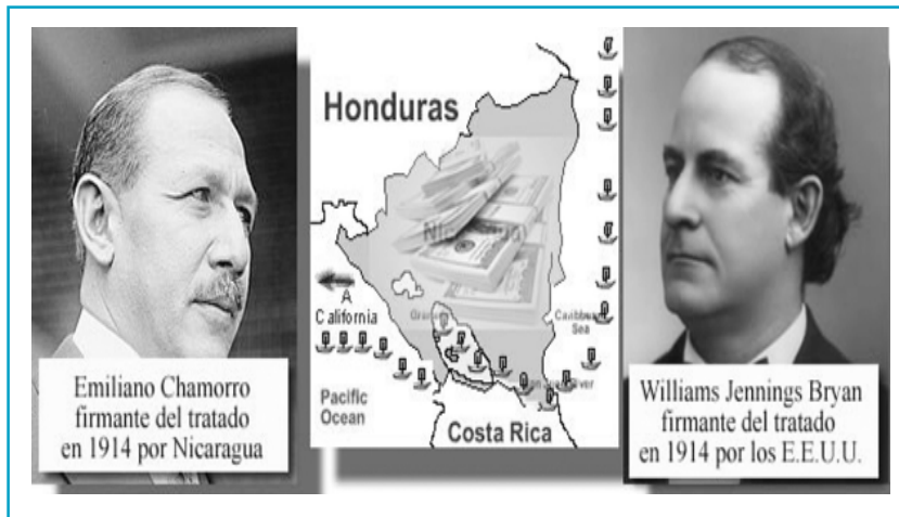
Emiliano Chamorro firmante del tratado en 1914 por Nicaragua

1948: William F. Knowland, Senador por California, introdujo dos proyectos de leyes; el uno, autorizando la revisión del Reporte Sultan (véase 1929) y el otro, sobre la construcción, mantenimiento y operación de un Canal Interoceánico a través de Nicaragua. Ambos proyectos pasaron a las Comisiones respectivas.