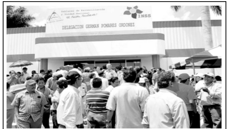
Jubilados protestan, por la falta de medicina.

Revisar los años de jubilación. Avendaño propone re-