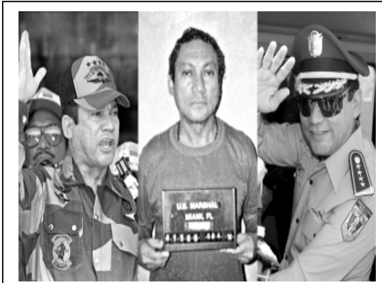
La muerte de Noriega, cierra un capítulo negro en la historia de América.

Los médicos aseguraron que esa masa en el cerebro creció. No obstante, hubo quien, como su antaño aliado, el exgeneral de la Guardia Nacional Rubén Darío, aseguró que la salud del autócrata panameño se había ido deteriorando pero que la "realidad había sido inflada" para conseguir su excarcelación. Noriega, como tantos otros dictadores latinoamericanos, quería morir en libertad. No lo logró.