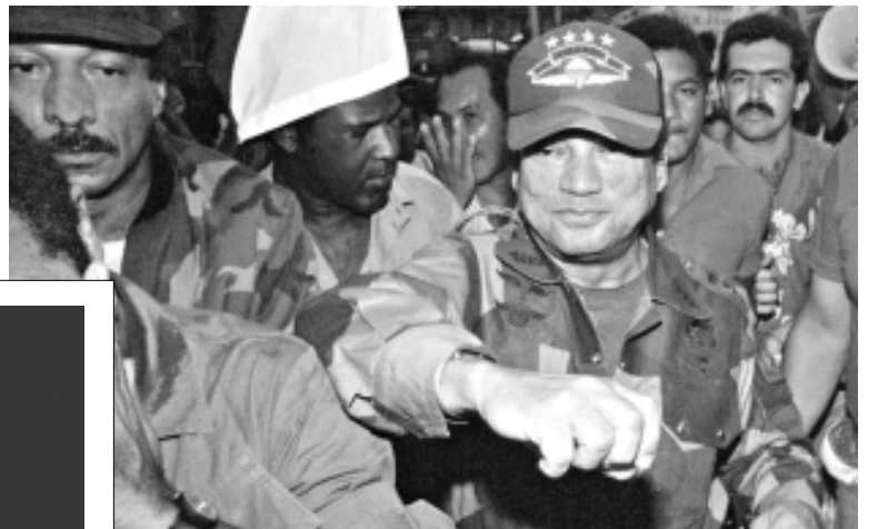
El "Hombre Fuerte de Panamá", el déspota, el dictador, en sus momentos de gloria, será una negra referencia en la historia latinoamericana.