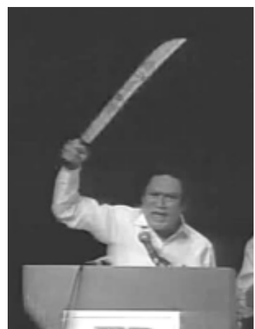
Muchos recordarán al Gral. Noriega blandiendo su filoso machete, retando a los gringos, y después, ¿qué pasó?