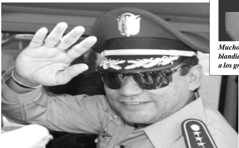
El pasado lunes 29 de mayo, falleció uno de los dictadores más crueles, que han asolado Latinoamérica. Manuel A. Noriega, quien incidió en la tragedia de Nicaragua.