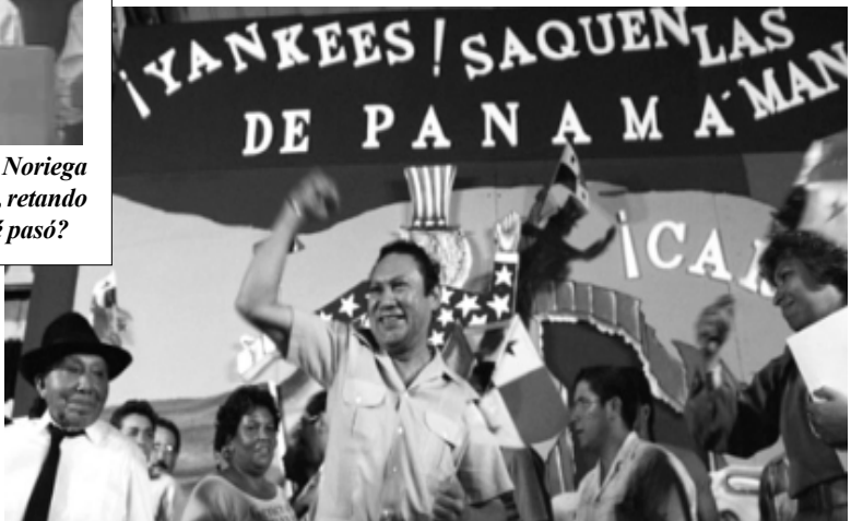
Indudablemente los dañinos dictadores en América, poco a poco se extinguen, pero sus tropelías perdurarán en las mentes, de quienes han sufridos sus desmanes.