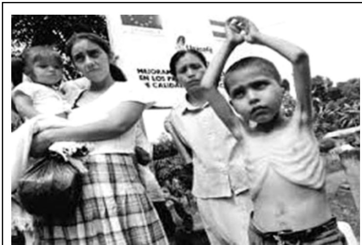
La desnutrición producto de la pobreza en Nicaragua, se ensaña en la niñez.

vienda y obtener unos ingresos adecuados al mismo tiempo. Aun sin mencionar el grado de dificultad que poseen los pocos profesionales para ejercer la