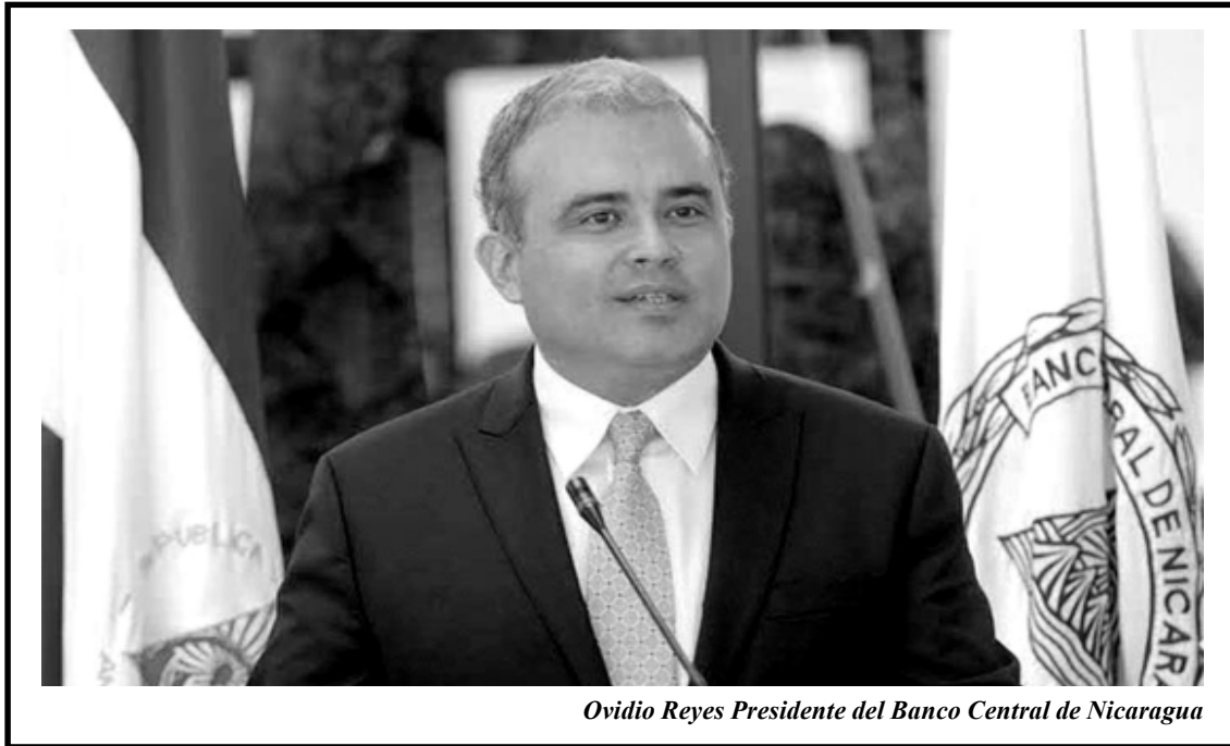
Ovidio Reyes Presidente del Banco Central de Nicaragua

las personas mayores a 14 años del total de población que participan en la actividad laboral, se