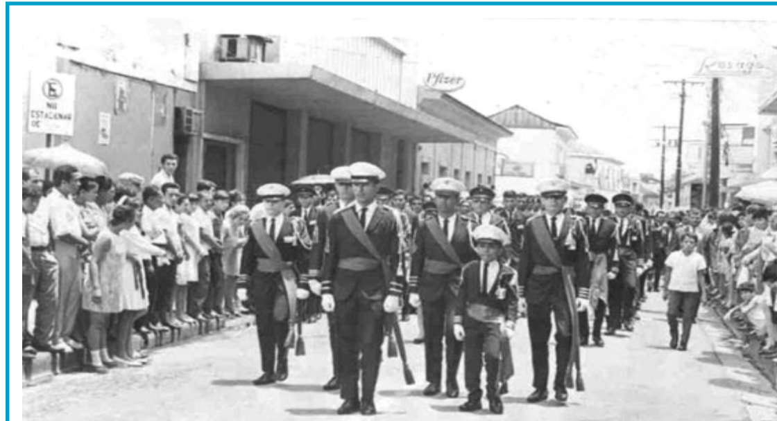
Desfiles alusivos a la patria de hace 55 años en Managua, NICARAGUA.

Cuando dentro de unas horas todos nos hayamos marchado y queden nuevamente solos estos parques y edificios consagratorios siempre estarán en ellos, cerca de la Catedral con que invocamos la protección del Supremo Hacedor, siempre estarán en ellos, JOSE DOLORES ESTRADA velando por la integridad territorial y RUBEN DARIO por la unidad y el prestigio cultural de Nicaragua.