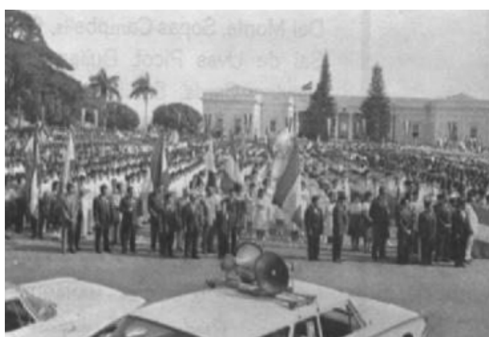
Desfile y juramentación de la Patria en la Plaza de la República.

inmortal con que Emmanuel Mongalo, sin temor al peligro, incendió el Mesón de Rivas para ahuyentar al invasor, y con-