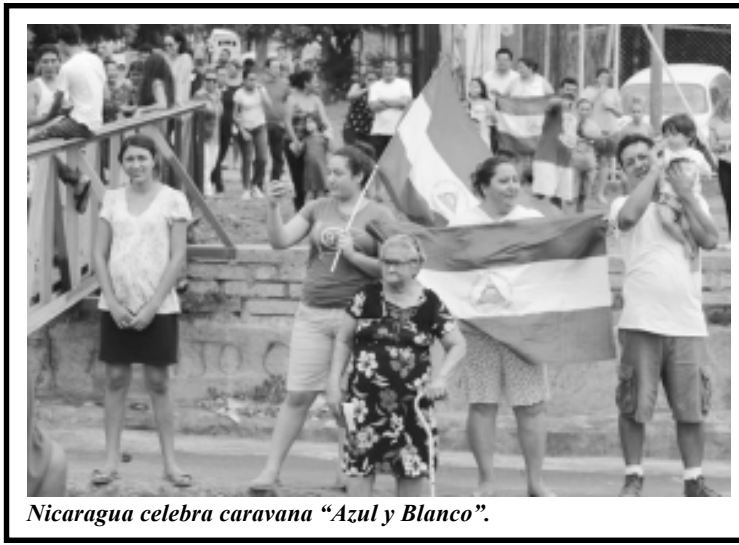
Nicaragua celebra caravana "Azul y Blanco".

Mercenarios de la religión que con el disfraz de Pastores pastorean diezmos en sus negocios de Iglesias, mansiones, empresas radiales y televisivas "bendecidos" de forma magnánima por la dictadura a cambio de oraciones en Parlamentos y plazas públicas. Jamás un atisbo de vergüenza. Sonríen, se abrazan entre sí, tocan guitarra y cantan canciones de la Purísima a su fea benefactora en plena vía pública cuyas sotanas son sacudidas por el viento callejero. Pena, pena y más pena. Eso no existe, se impone la donación "a la iglesia tal o cual". Un circo devaluado por la miseria humana con una carpa destruida por el huracán del pueblo que despertó el 19 de Abril recién pasado gracias a la sangre de jóvenes henchidos de amor a Nicaragua. La perversidad sonríe "del diente al