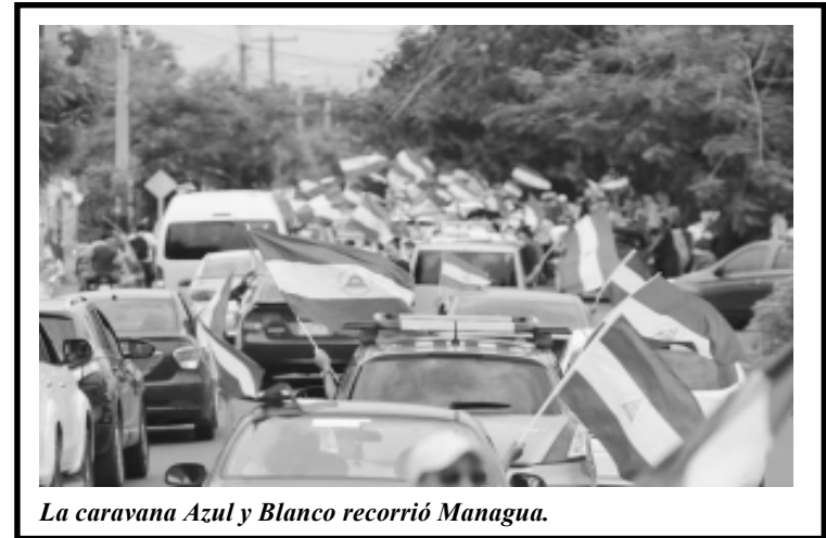
La caravana Azul y Blanco recorrió Managua.