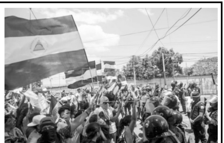
Movimientos sociales se unen y llaman a la desobediencia civil en Nicaragua.

yor resistencia. Es Nicaragua refractaria a cualquier dominación criminal. Deserciones masivas de Policías, Jefes policiales de alto rango odiados por una población que sangra; au-