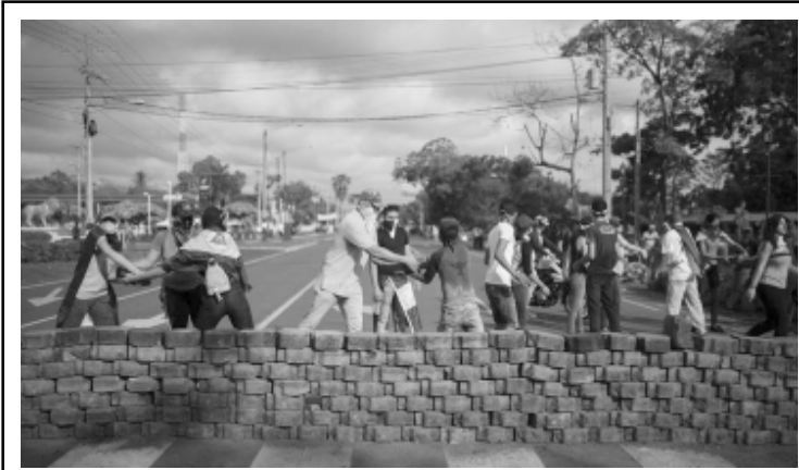
Los tranques en las vías se triplicaron en Nicaragua, tras los ataques de la Policía en contra "del pueblo".

Los tranques en vez de minimizarse van multiplicándose a lo largo y ancho del país. La economía de forma acelerada deteriorándose. La mayoría del