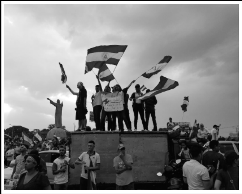
Por esos muertos, nuestros muertos..... Pido castigo