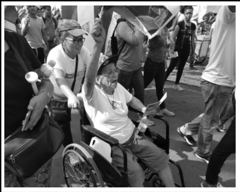
Para el verdugo que mandó esta muerte... Pido castigo