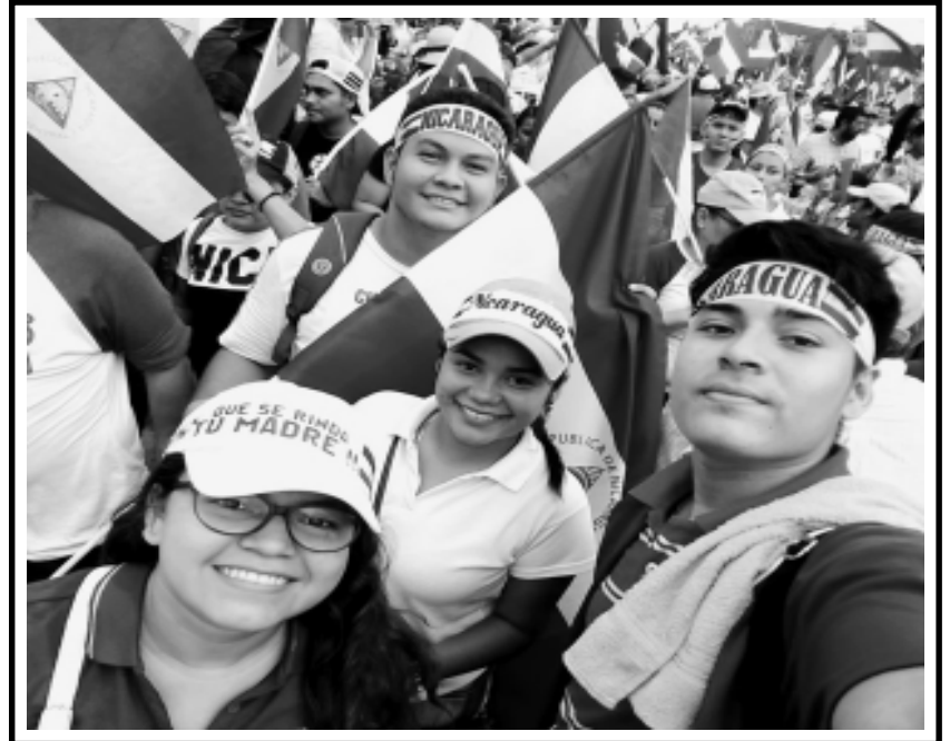
Para el traidor que ascendio sobre el crimen... Pido castigo