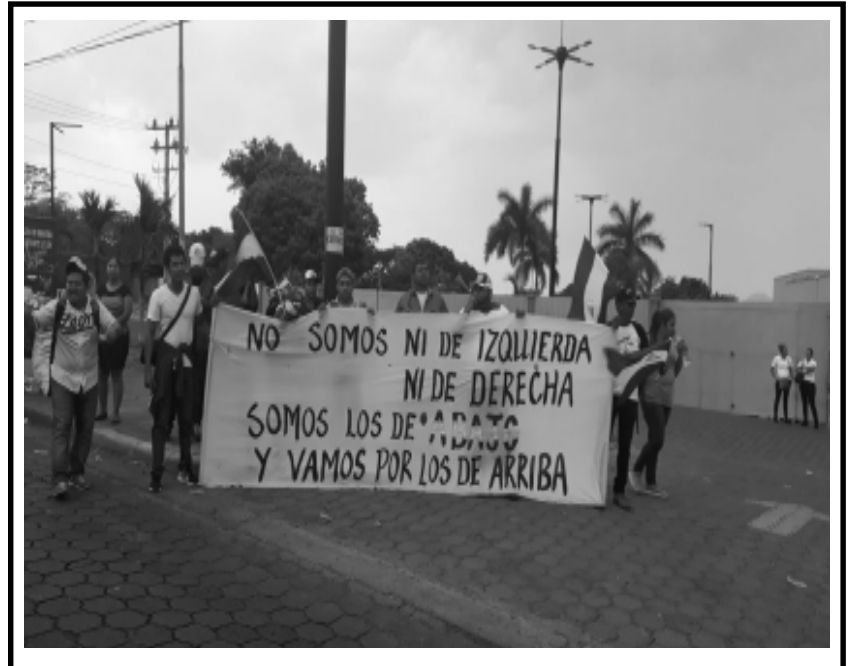
Para los que defendieron este crimen... Pido castigo