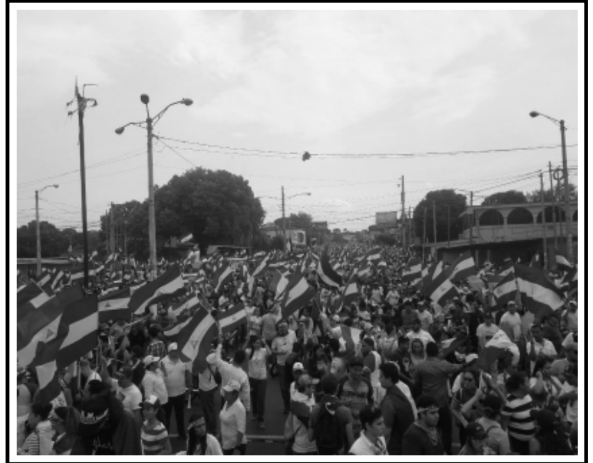
Para los que de sangre salpicaron la Patria... Pido castigo