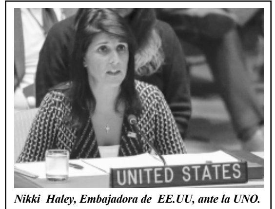
Nikki Haley, Embajadora de EE.UU., ante la UNO.

"Todos hemos visto el trágico sufrimiento del pueblo venezolano. En una región donde el 31 por ciento de las personas son pobres, un impresionante 87 por ciento de los venezolanos