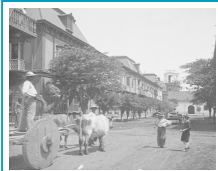
Vista parcial de la Managua del Siglo antepasado -final de XVIII-.

Art. Unico. Se destinan quince mil pesos del erario para premiar a los empresarios de café que dentro de siete años obtengan cosechas conforme al reglamento que