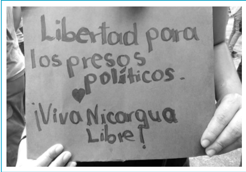
Mensaje común en toda Nicaragua y países con diáspora nicaragüense. Todos demandan libertad para los prisioneros y fin a la represión.