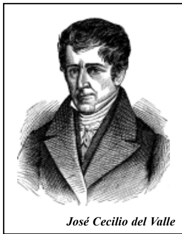
José Cecilio del Valle

Cuenta la historia que la noche del 14 de Septiembre de 1821, la gente se amotinó en las calles de Guatemala, marchando y gritando "¡Independencia o muerte!". Toda la noche duró aquella agitación popular.