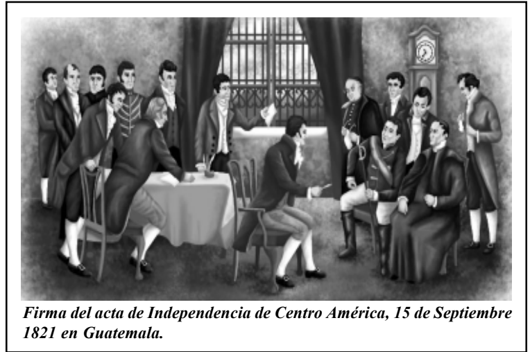
Firma del acta de Independencia de Centro América, 15 de Septiembre 1821 en Guatemala.

El 15 de Septiembre de 1821, día de la firma del Acta de Independencia se reunieron en el Palacio de los Capitanes Generales, en la ciudad de Guatemala, personalidades y: representantes del Gobierno Central español, del Ayuntamiento Local, Superiores de las diferentes órdenes religiosas, el arzobispo