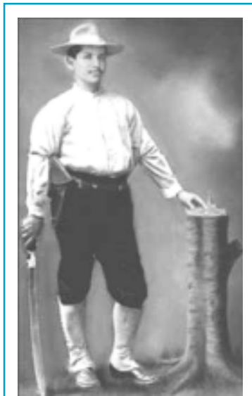
General Benjamín Zeledón

El 12 de septiembre de 1912 desembarcan 2,500 yanquis en nuestro país. El General Zeledón precursor de la lucha anti-