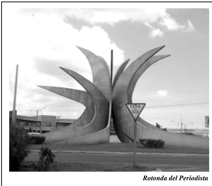
Rotonda del Periodista

He dado el apoyo para dignificar al periodismo nacional a través de la Orden Municipal “Juan Ramón Avilés”. Así mismo inicié como Alcalde el re-