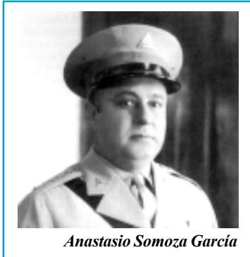
Anastasio Somoza García

Anastasio Somoza García nació el 1 de Febrero de 1896 en San Marcos Carazo, político, militar nicaragüense, de clase acomodada, hijo del senador y hacendado Anastasio Somoza Reyes y Julia García. Conocido con el nombre familiar "Tacho". Fue director auxiliar de la Guardia Nacional en 1932 y después jefe de ésta en 1933. Como jefe y director de la Guardia Nacional planeó el asesinato del general Sandino el 21 de febrero de 1934.